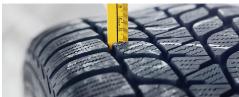
Pneus et roues