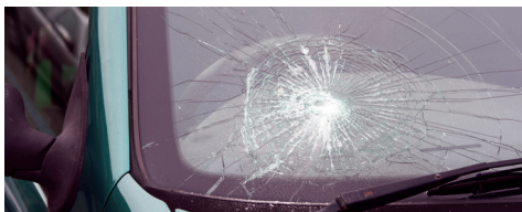
Vitre écaillée ou fissurée